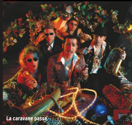
La caravane passe